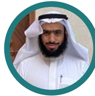
عبدالله بن محمد بن منصور المنصور